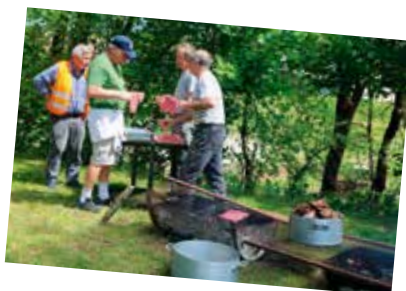
Préparation du repas