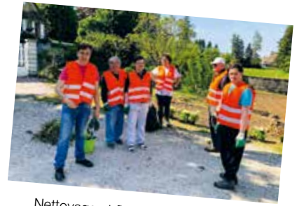
Nettoyage et fleurissement (Mirebel)