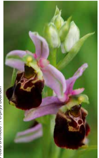
Fleurs orchidée : l'Orphys Bourdon