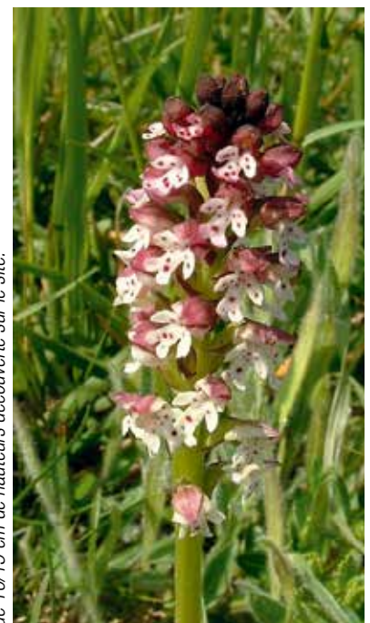
Orchis brûlée (Neotinea ustulata), petite orchidée de 10/15 cm de hauteurs découverte sur le site.

Plus d'information : Anaïs MOTTET - 06 30 34 45 52