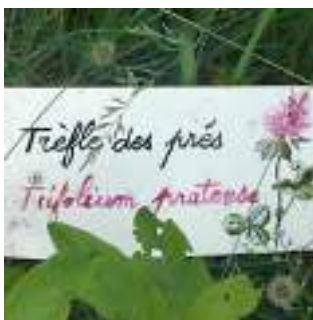
Quelques photos du sentier botanique