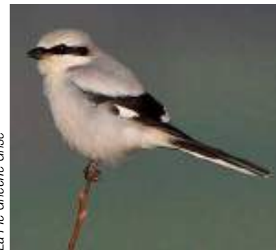
La Pie Grièche Grise