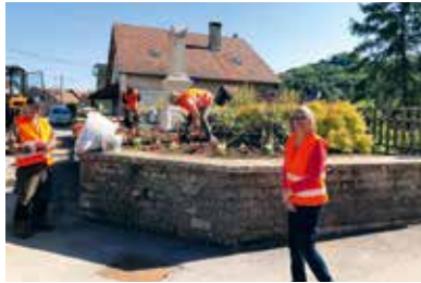
Nettoyage et fleurissement (Mirebel)