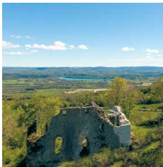
Le Lac de Chalain et ses alentours