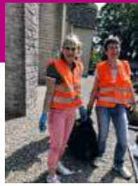
Nettoyage cimetière (Granges s/ Baume)