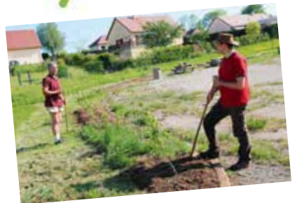
Entretien du verger