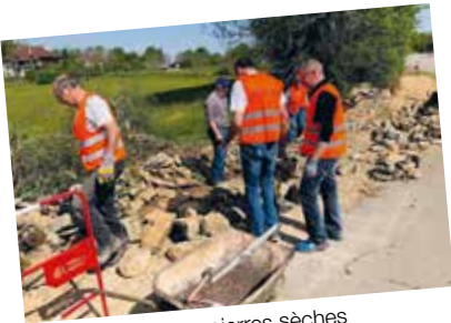
Mur en pierres sèches (rue de la Croix Blanche-Crançot)