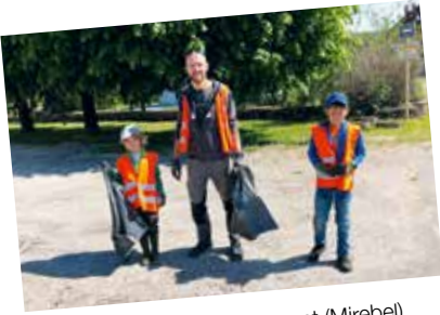
Nettoyage et fleurissement (Mirebel)