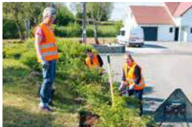
Nettoyage et fleurissement (Crançot)