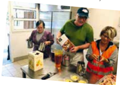
Préparation du repas