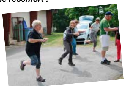
...et la journée se termine par...une petite danse !