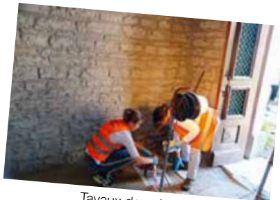
Travaux de peinture (Chapelle de Granges-sur-Baume)