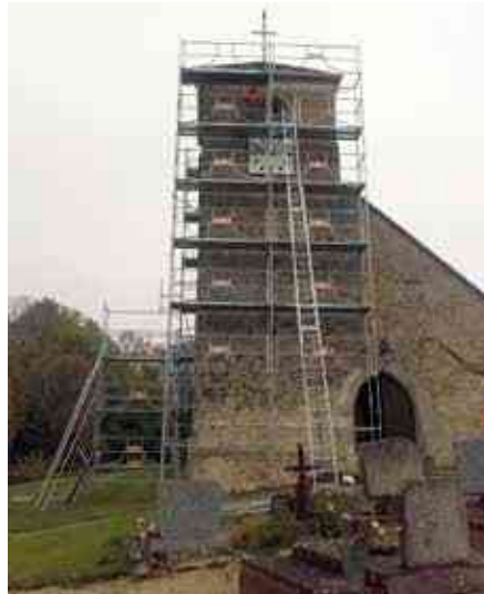
Mise en place des échafaudages sur l'Eglise de Mirebel

Des travaux d'entretien sur cet édifice étaient nécessaires suite à des infiltrations d'eaux pluviales. Un échafaudage conséquent rendu obligatoire pour la réalisation de ceux-ci fut donc érigé autour du clocher. Des plaques de vieux mortiers se décollaient sur le pignon