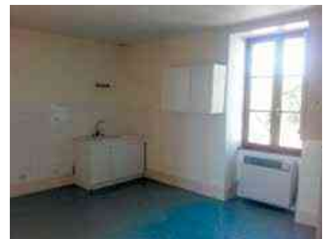
Cuisine de l'appartement avant travaux

Cet appartement situé à l'étage du bâtiment communal, inoccupé depuis quelques mois, a trouvé un nouveau locataire. Un petit aménagement côté cuisine semblait nécessaire. Etudié par la commission « bâtiment », puis accepté par le conseil municipal, des éléments muraux, plan de travail, hotte, etc. seront installés par les employés municipaux. Souhaitons à ce jeune maconnais, en formation dans une concession de matériel agricole locale, la bienvenue et une bonne intégration parmi nous.