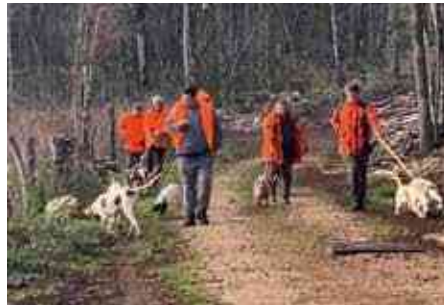
Départ pour la traque

Je rappelle que seuls les chasseurs financent entièrement les dégâts aux cultures auprès des exploitants agricoles. De plus, nous sommes tenus d'effectuer un prélèvement minimum obligatoire sur ces espèces de gibiers, soumises au plan de chasse.