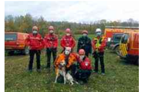
Un chien heureux retrouve son maître soulagé

J'aimerais, également, par cet article, remercier le Groupe de Reconnaissance et d'Intervention en Milieu Périlleux (GRIMP), d'être venu en aide à l'un de nos chiens, pris au piège sur une falaise au cours d'une battue.