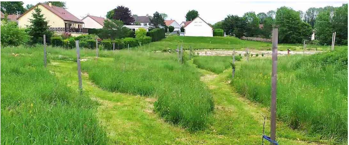
En mai, des chemins ont été tracés comme une invitation à se promener dans le verger.

Un second rôle, très important lui aussi, est de contribuer à la préservation et au développement de la biodiversité sur notre territoire. Nous avons pour cela commencé à réaliser divers aménagements en faveur de la faune et de la flore sauvages. Les enfants du club nature se sont notamment impliqués dans la réalisation de nichoirs pour les oiseaux et d'un gîte pour le hérisson. De nombreuses espèces de plantes sauvages mellifères ont également été plantées. C'est aussi pour cette raison que nous avons choisi de tondre la prairie en plusieurs phases. A certaines périodes de l'année, des chemins serpentent donc parmi les herbes hautes qui servent de refuges pour les nombreux insectes de la prairie.