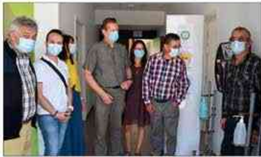
Le distributeur a été installé à l'entrée de la médiathèque.

Autre source de site de Commenailles, des distributions et des expositions seront prochainement organisées dans les médiathèques de la CCBHS.