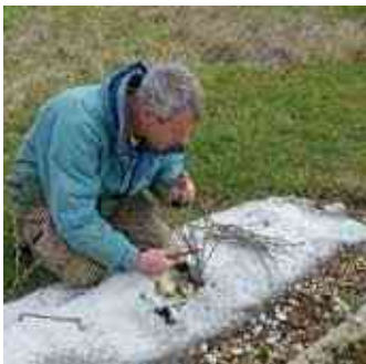
Taille des petits fruits