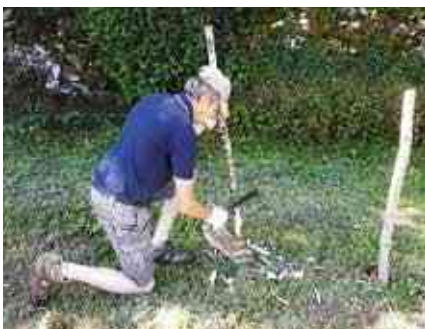
Création de l'espace ail des ours