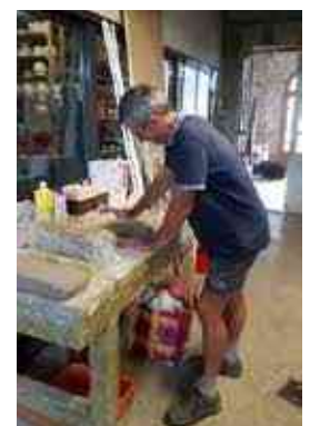
Atelier création de plaques d'argile, gravure des noms et peinture à l'oxyde de fer