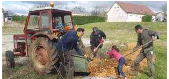
Paillage des plates-bandes