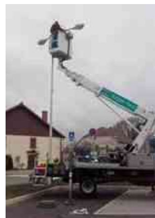
Placette « abris-bus »

Sur les trois villages de Hauteroche, une quinzaine de vieilles ampoules défectueuses ont été remplacées par des lampes LED, beaucoup moins énergivores, pour un éclairage identique.