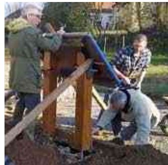
Pose et fixation du panneau