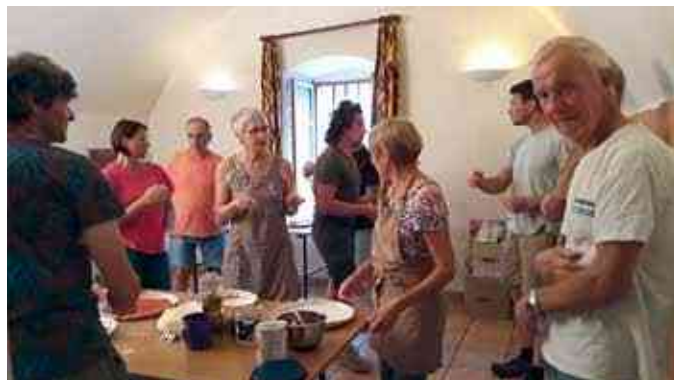
Les bénévoles de la PHM

Merci à tous les bénévoles qui œuvrent pour notre patrimoine commun, historique ou naturel.