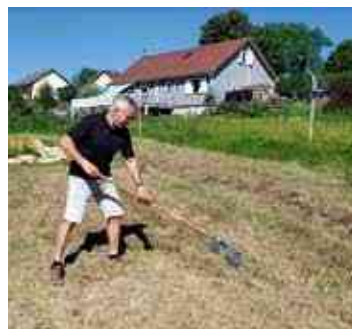
Ramassage du foin