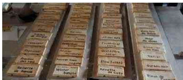
Les plaques n'attendent plus qu'à être posées.