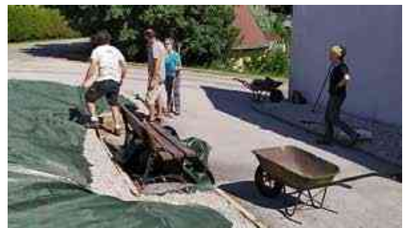
Création du massif de plantes médicinales