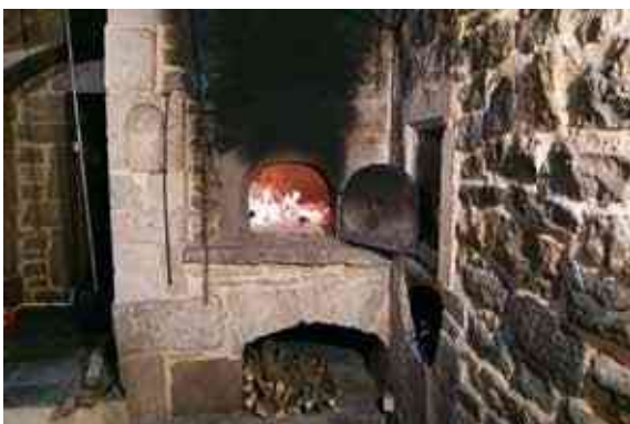
Four du tuyé restauré et en marche