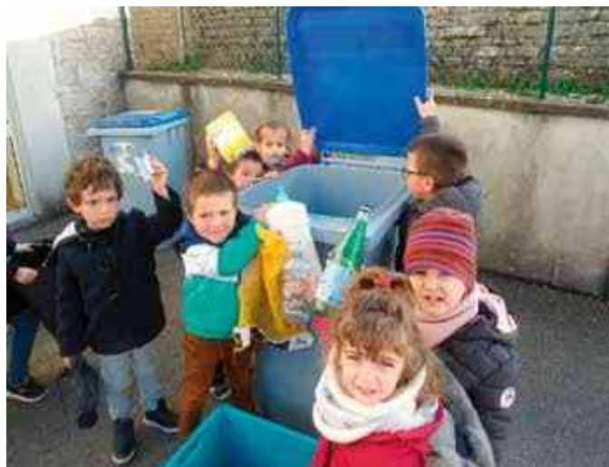
En classe de MS-GS, on apprend à trier nos déchets

L'équipe enseignante espère que ces projets pourront voir le jour malgré la crise sanitaire.