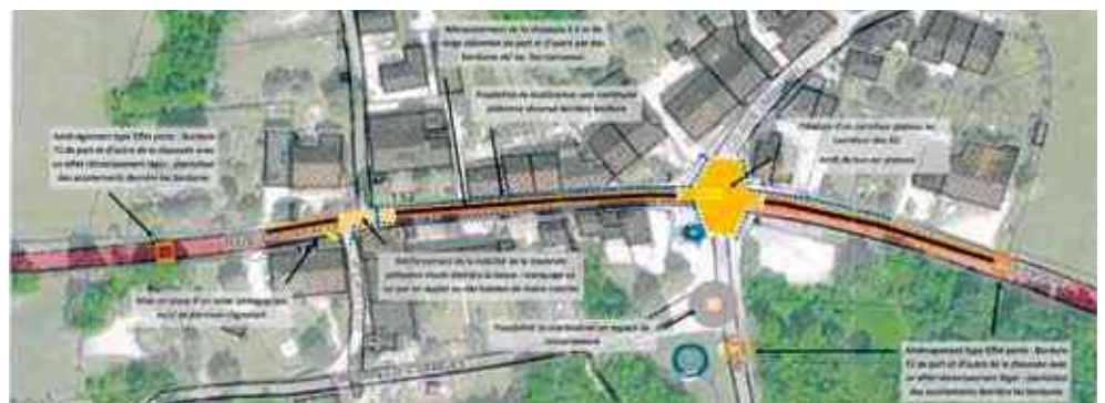
Schéma d'intention / ETP Aménagement de sécurité sur le tracé de la RD471

Le projet s'appuiera sur la pré-étude réalisée par le Cabinet ABCD (voir ci-contre). Cette pré-étude ne présage pas des décisions qui seront prises. Le comité devra donner son avis et le projet sera présenté à la population avant d'être adopté par le conseil municipal.