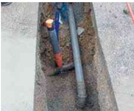
Vérification de raccordement sur construction nouvelle

Après résultat d'analyse des effluents, en entrée de station, une arrivée anormale d'eaux pluviales est constatée à plusieurs reprises. Ce phénomène n'est pas nouveau mais semble empirer d'année en année. Dernièrement, certains quartiers ont fait l'objet de contrôles en période pluvieuse et certaines habitations se sont révélées en « défaut de raccordement ». Un projet de contrôle individuel est à l'étude avec un organisme habilité (enfumage, coloration...) car le fonctionnement de la station est perturbé par cet excès d'eau parasite : bassins inondés, usure des pompes de relevage prématurée, consommation d'électricité en hausse... L'ensemble de ces éléments entraîne un coût très important à répercuter sur le budget « assainissement communal ». Un contrôle de raccordement Eaux Usées (EU) sera rendu obligatoire pour chaque construction nouvelle. Chacun doit être conscient du bon fonctionnement de la Station de Traitement des Eaux Usées (STEU), afin que celle-ci rejette une eau traitée correspondant aux normes actuelles.